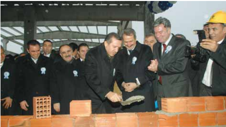
Başkent OSB’ye ilk tuğla 2003 yılında Başbakan Recep Tayyip Erdoğan tarafından konulmuştu.

Sayın Nihat Ergün’ün henüz Sanayi ve Ticaret Bakanı olmadan önce de sanayicilerin sorunlarıyla birebir ilgili olduğunu söyleyen Türk, “Grup Başkanvekili iken de sanayi konusunda yaptığımız girişimlerde bizlere destek oldunuz. Hem yasa hazırlanması, hem yasanın doğru çıkması, hem konunun ülke açısından duyarlılığını değişik platformlarda dile getirmenizden dolayı ben ayrıca size teşekkür ederim. İnşallah daha güzel günlerde ve bu kriz ortamından kurtulmuş bir dünyada, Türkiye’de daha başarılı işleri birlikte yapacağız diye düşünüyorum” diye konuştu.